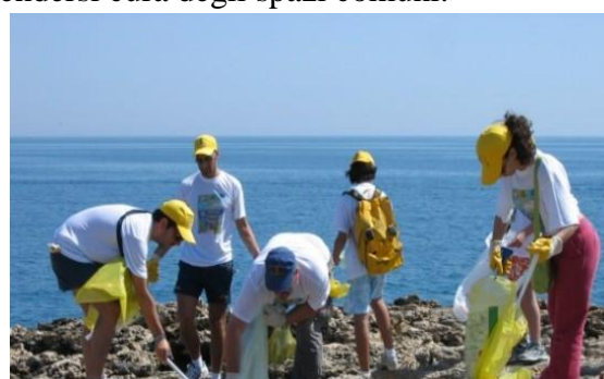
SPIAGGE PULITE (Maggio 2013)

Stimola cittadini ed istituzioni al rispetto dell'ambiente marino. Campagna di monitoraggio della qualità delle acque di balneazione