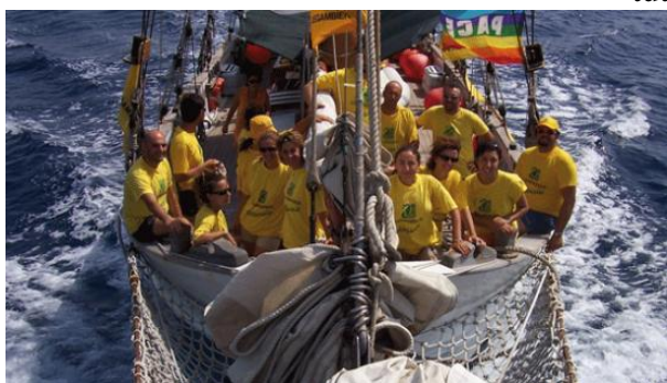
GOLETTA VERDE (Giugno – Luglio 2013)

Un'occasione per migliorare la vivibilità all'interno della scuola, confrontarsi sui temi ambientali, i promuovere il senso civico e la consapevolezza di appartenere ad una collettività dove è responsabilità di tutti prendersi cura degli spazi comuni.