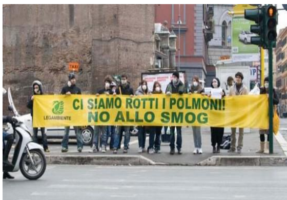
MAL'ARIA (Gennaio 2013)

Città italiane malate croniche di traffico e smog. Iniziativa di sensibilizzazione per cittadini e gli amministratori