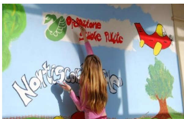
NONTISCORDARDIME' – OPERAZIONE SCUOLE PULITE (Marzo 2012)

Città italiane malate croniche di traffico e smog. Iniziativa di sensibilizzazione per cittadini e gli amministratori